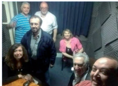
Los locutores de la radio de los locutores

En el sentido más amplio; desde la iniciativa de la CDN para crear nuestro propio medio, seguida por la construcción de un estudio en la sede de Vidt 2011 y la selección del equipamiento técnico adecuado, hasta emitir diariamente notas de interés general y otras específicas para los locutores y comunicadores. La palabra de nuestro presidente, estampas de la vieja de radio y