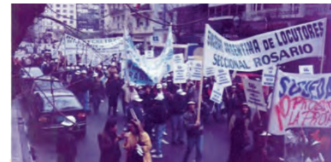
Compañeros de distintas seccionales del país se sumaron a la movilización

La SAL lo está intentando. No es fácil. No son 'moda' los intereses profesionales. Además algunos legisladores, notados por suerte, están absorbidos por las elecciones del año próximo. Pero no desmayemos. Suele ser una regla no desmentida que los meses previos a las elecciones suelen ser propicios para llegar a los diputados y senadores y lograr algo más que ser simplemente escuchados". VOCES - Gaceta del Locutor. Publicación de la Sociedad Argentina de Locutores N° 10 - julio de 1998.