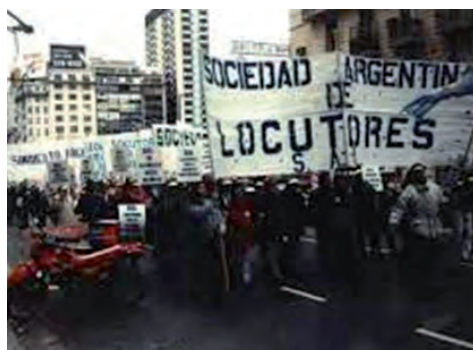
Cuando atacan nuestra profesionalidad, así nos movilizamos

Luego de las habituales formalidades, la Asamblea General Extraordinaria reunida el 27 de mayo de 1997 declara al gremio en es-