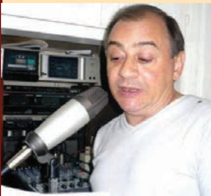
“Tajita” frente a un micrófono, que fue siempre su compañero

También muy joven y con su título de Locutor Nacional, llegó a Radio Rufo. Después a Buenos Aires.