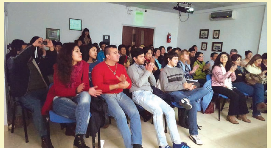
Público altamente interesado en el Taller de la Voz

Entre los temas desarrollados estuvieron: "La voz profesional", su definición, sistemas que intervienen en la voz y taller práctico sobre uso y mal uso de la voz. Más de 50 personas compusieron un auditorio sumamente interesado. Vale destacar que muchas de ellas llegaron desde distintos lugares del interior provincial como Iruya, General Güemes, San Antonio de los Cobres, Rosario de la Frontera, Valle de Lerma y también de la provincia de Jujuy. El costo de la inscripción fue sólo de un alimento no perecedero y al final del taller se entregaron certificados.