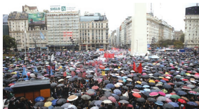
La tarde gris no a amilanó la convocatoria

Pese a las inclemencias del clima, el obelisco se colmó de mujeres ataviadas con ropa negra, según se había acordado y luego iniciaron una marcha que llegó a Plaza de Mayo.