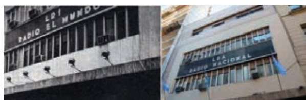
Ayer y hoy en Maipú 555

Más claro, complementamos desde la CDN: ¿Querés ser locutor? ¡Estudiá...!