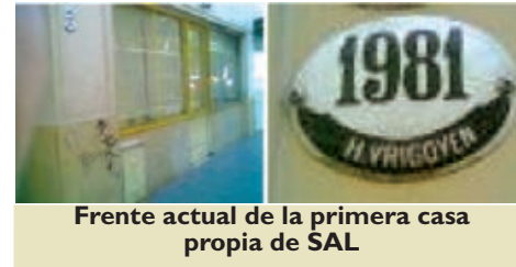
Frente actual de la primera casa propia de SAL