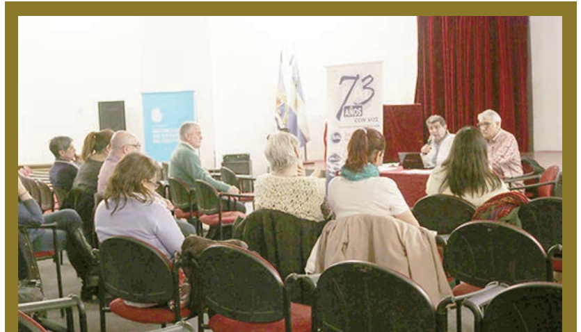
Quedó fundada la Regional Patagonia Sur