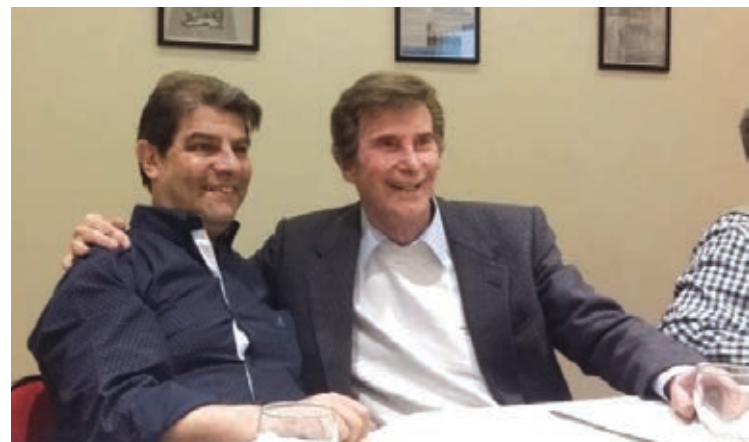
Distendida charla con nuestro presidente

Al contrario fueron cercenándose. En televisión, por ejemplo, el actor tenía que poseer carnet de locutor en cámara para hacer avisos, eso creo que no existe más. Parece que ahora cualquiera hace avisos. Yo lo comenté en la Asamblea que hubo en la SAL (NdelR: se llevó a cabo 31 de agosto último) que para ser animador había que ser locutor. Comenzabas como locutor y luego ascendías, de alguna manera, a ser conductor de un programa. Hasta que ese modelo se rompió y ahora hace conducción cualquiera, antes, no estaba escrito, pero se hacía de esa forma. En la actualidad, el locutor quedó relegado en ese sentido; hoy conducen una modelo, una actriz o un mediático. Hoy cualquiera puede llegar a ser locutor de un programa. Uno de los fundadores de la SAL, Roberto Galán, comenzó como locutor y después se hizo animador. Así hay una cantidad de miles de ejemplos como Cacho Fontana, Héctor Larrea y muchos más.